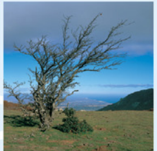
Ras de la Morta

de pinastre (4 h 10 min) i a l'encreuament d'una pista, seguim la de la dreta. Creuem el torrent de Coll Pregon (4h 25 min) i deixem a dreta el corriol que puja al pou de glaç. Continuem pista amunt, creuem el pont de fusta, deixem a la dreta el fom de Rajols i sortim a la pista de Cantallops a Requesens (4 h 35 min) . Tornem a la dreta, deixem la pista de puig Neulós també a la nostra dreta i continuem pujant fins a tornar al veïnat de Requesens (4 h 45 min) .