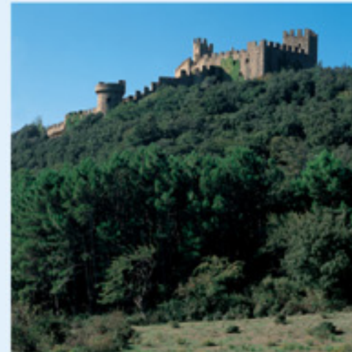
Castell de Requesens