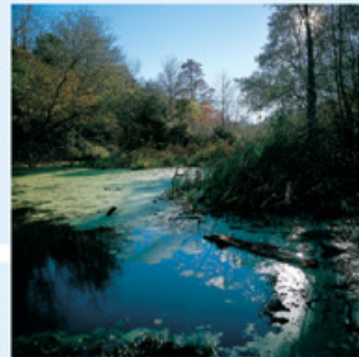
Embassament de Requesens

a trobar a la font Rovellada (1 h 17 min) que també trobem a mà dreta. Creuem el pont i girem a l'esquerra. Poc després agafem un corriol que surt a l'esquerra i ens porta a la Serradora (1 h 21 min) . Continuem fins al cedre i seguirem per una pista a la dreta fins a arribar a l'alçada d'un edifici que trobem a la dreta. En aquest punt agafarem el corriol que surt a l'esquerra i que ens portarà altre cop al veïnat (1 h 40 min) .